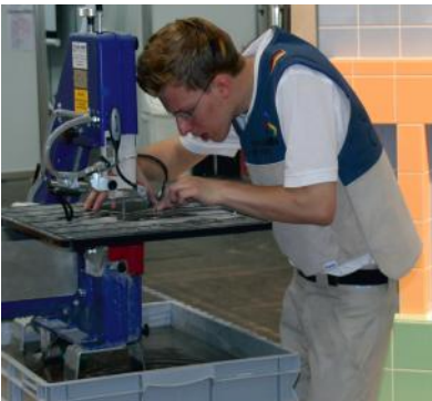
Auf den Millimeter kommt es an!