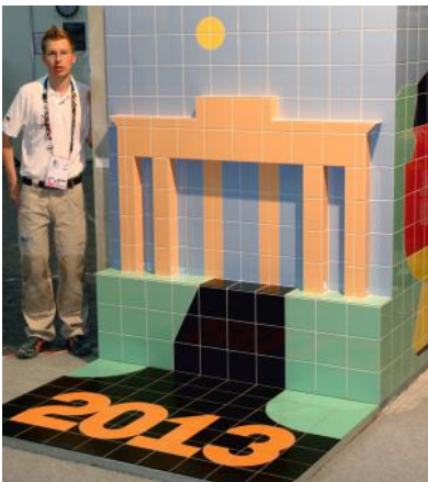
21 Stunden und 45 Minuten - geschafft !

BIG BAU BEGEISTERN INFORMIEREN GEWINNEN INTERESSIEREN