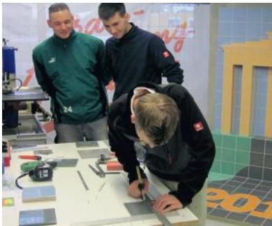
Trainingslager im Bau-ABC Rostrup