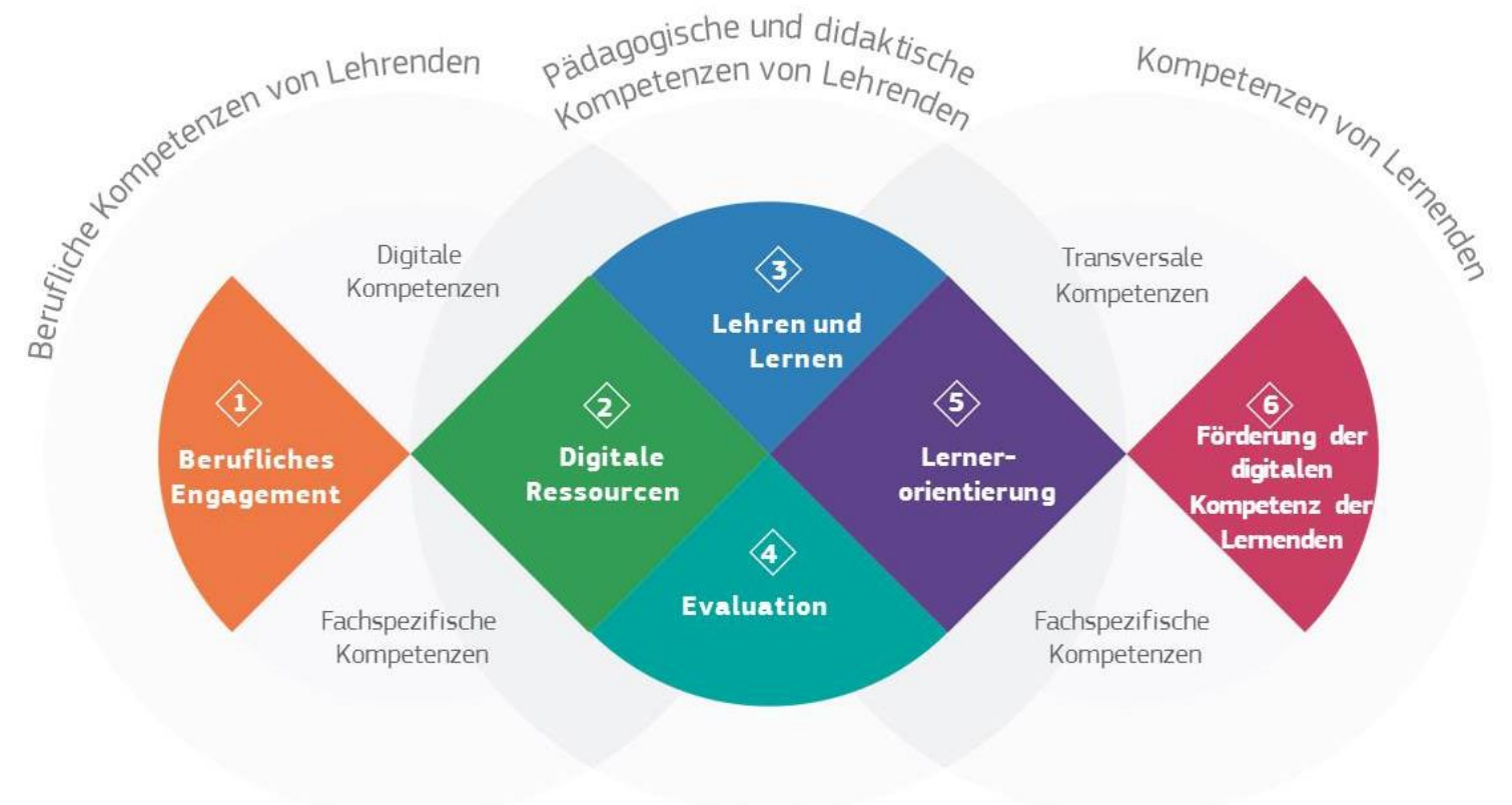
Abbildung 1: Der DigCompEdu Kompetenzrahmen

Die Bereiche 2 bis 5 bilden den pädagogischen und didaktischen Kern des Kompetenzrahmens. Diese Kompetenzen beschreiben, wie Lehrende digitale Medien effektiv und innovativ einsetzen können, um Lehr- und Lernstrategien zu verbessern.